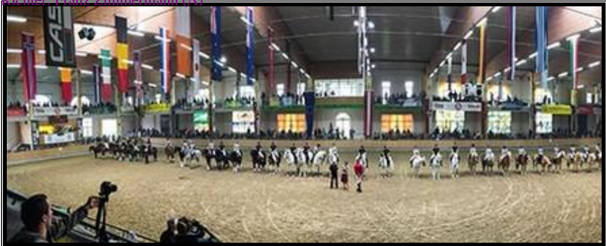
Einblick in die Veranstaltungshalle Stadl Paura